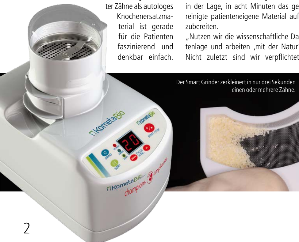
Der Smart Grinder zerkleinert in nur drei Sekunden einen oder mehrere Zähne.

Weitere Informationen zum Produkt stehen auf der Website des Unternehmens zur Verfügung.